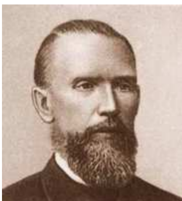
Адвокат П.А. Александров