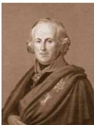
Граф Н.С. Мордвинов

Из-за разногласий в Сенате дело перешло в Государственный Совет, где разбирательство было поручено главе Департамента гражданских и духовных дел адмиралу графу Николаю Семеновичу Мордвинову.