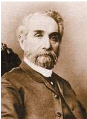
Профессор Д.А. Хвольсон

Резник показывает, что публикация рукописи Скрипицына вызвала резкую реакцию со стороны противников кровавого навета. Профессор Петербургского университета и Петербургской духовной академии, член-корреспондент императорской Академии наук, историк, теолог и гебраист, выдающийся знаток истории иудаизма и христианства, специалист по еврейскому, халдейскому и сирийскому языкам Даниил Авраамович Хвольсон в своей книге «Употребляют ли евреи христианскую кровь?...» (СПб, 1879) доказал полную никчемность текста Скрипицына как сочинения невежды, который большинство сведений почерпнул из двух антисемитских пасквилей, но не способен был оценить их критически.