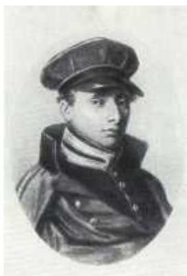
В.И.Даль в молодые годы